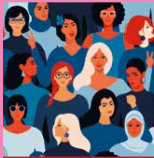
Table ronde au féminin

Des femmes audacieuses et rebelles qui s'engagent